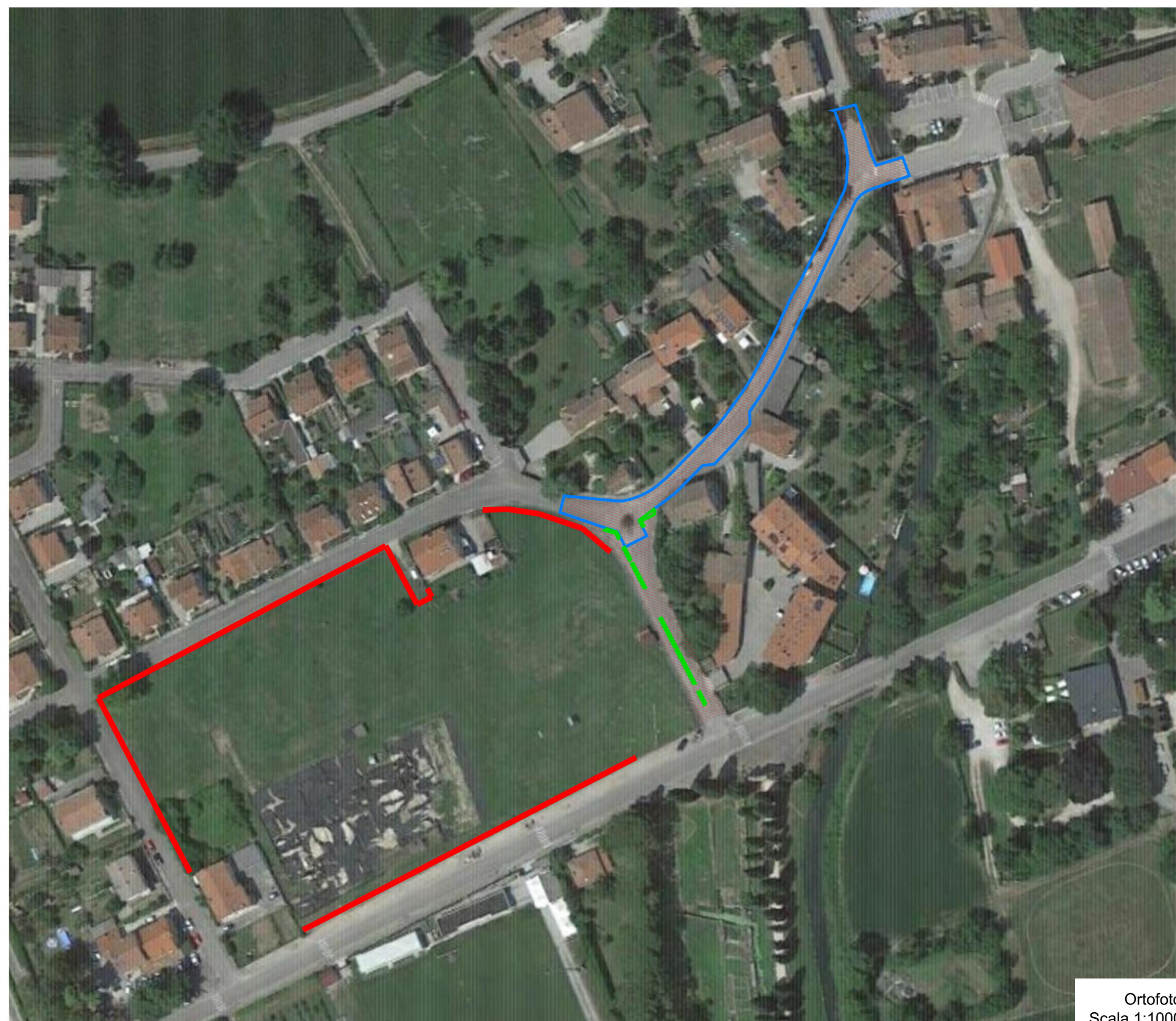
Ortofoto Scala 1:1000