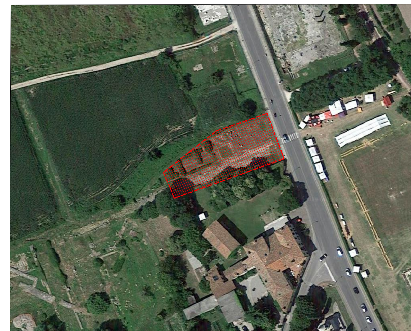
Area di intervento