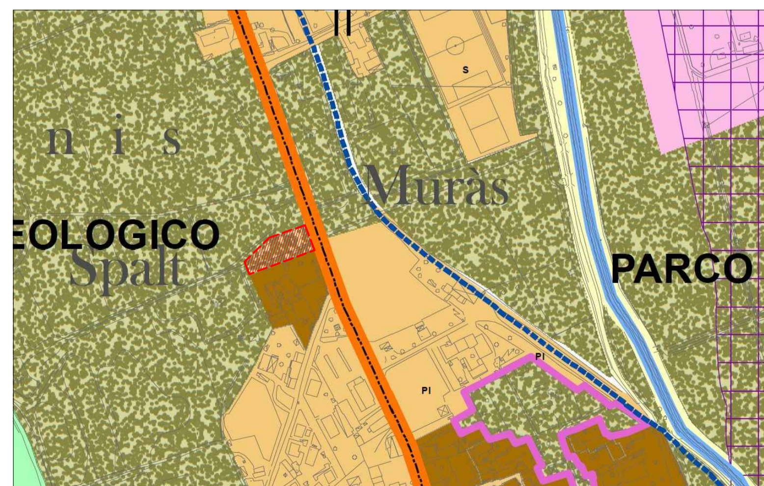
Zona di interesse archeologico (sottozona A1 compresa nel parco archeologico)