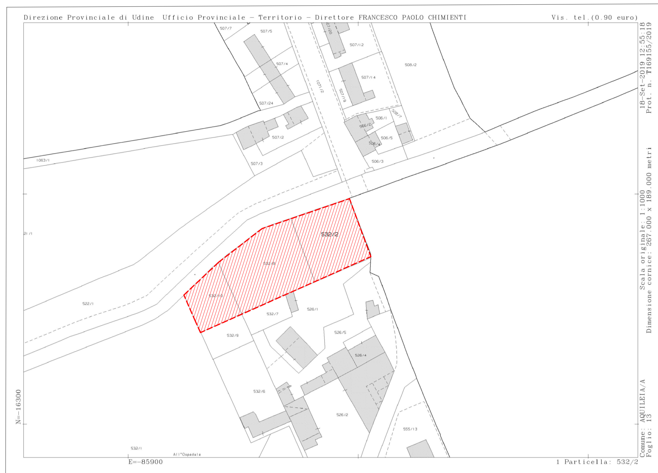
Area di intervento