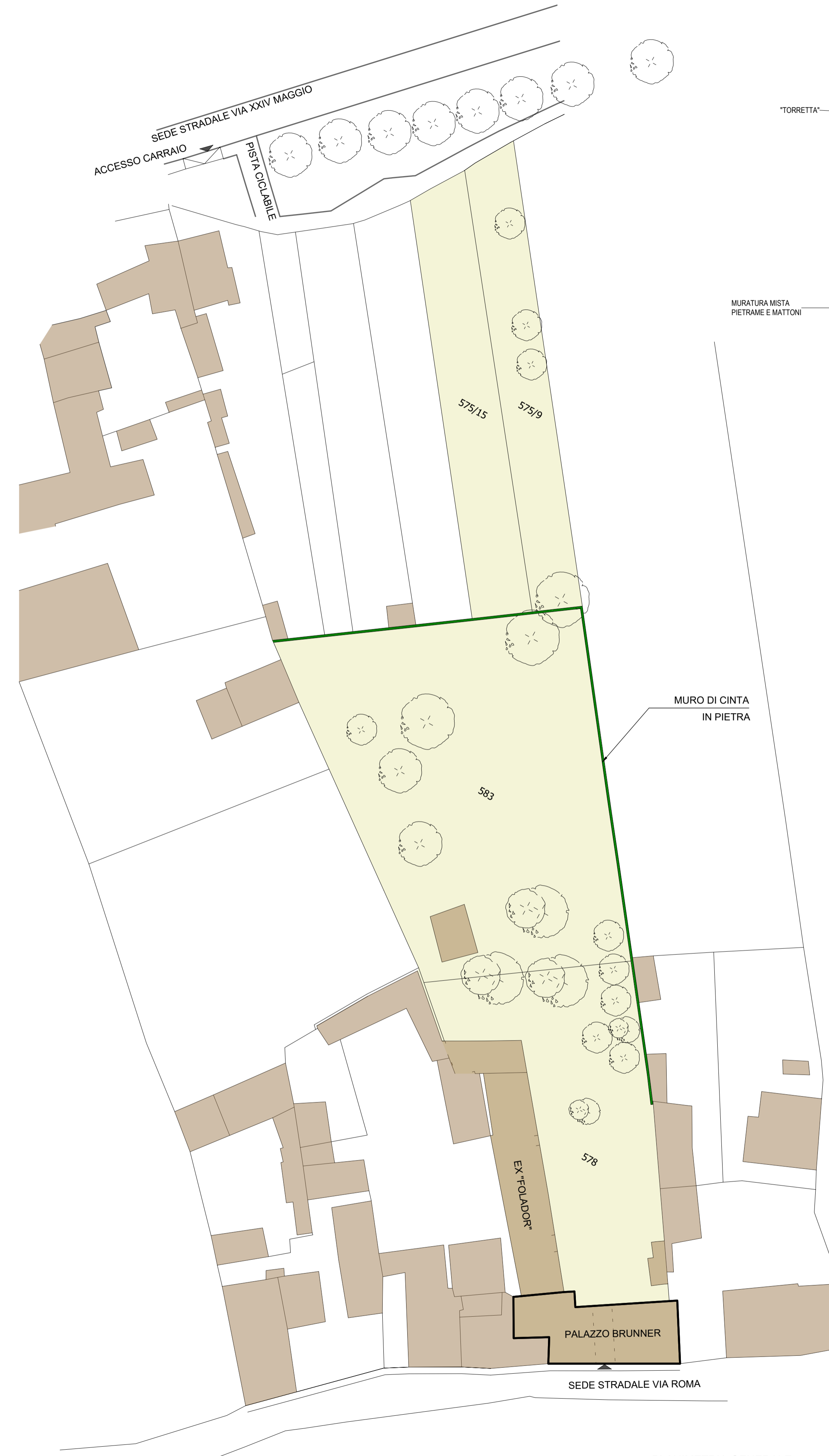
PLANIMETRIA GENERALE STATO DI FATTO Scala 1:1000