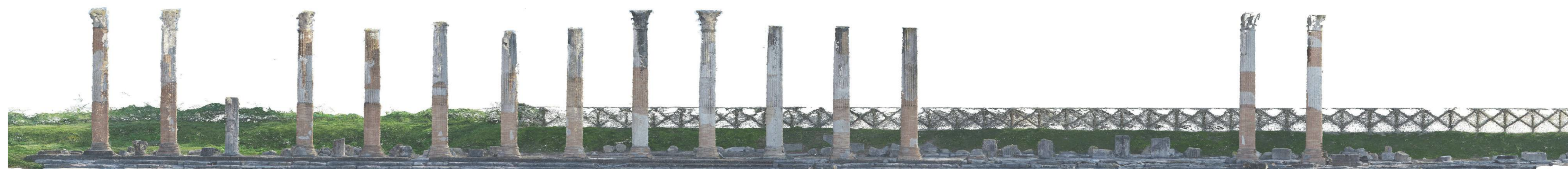
FOTOPIANO SEZIONE B-B